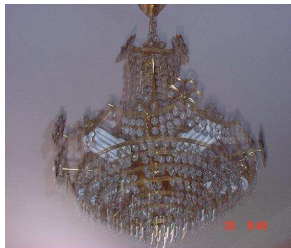
Lampes à Basse Consommation