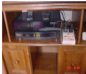
Coupes Veille manuels