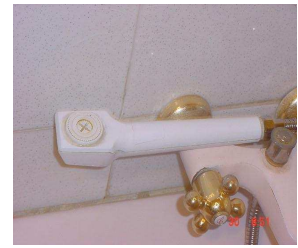
Douchette à limitation pression